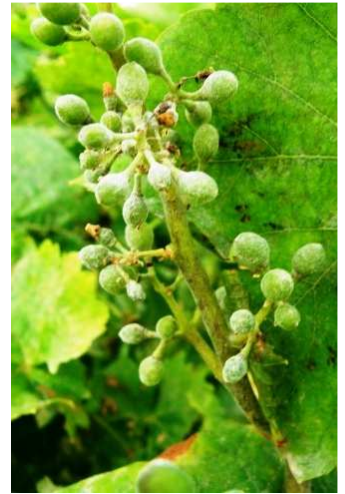
Ωίδιο. Προσβολή σε νεαρές ράγες