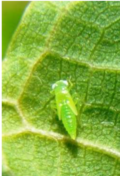
Τζιτζικάκι. Προνύμφη του εντόμου. Δεν πετά, είναι στην κάτω πλευρά του φύλλου, βαδίζει με πλάγια κίνηση.