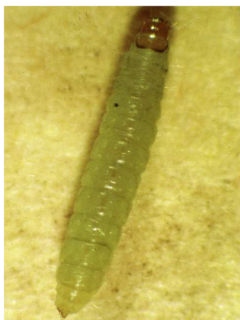
Ευδεμίδα. Προνύμφη πολύ ευκίνητη, μέχρι 1εκ. μήκος.