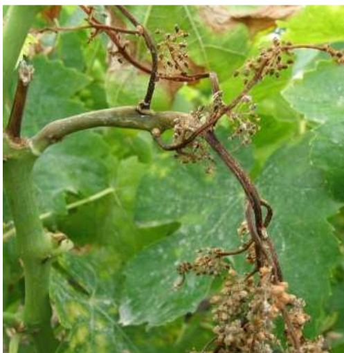
Περονόσπορος. Προσβολή στο σταφύλι. Μοιάζουν με «βρασμένα χόρτα», ξεραίνονται τμήματα ή και ολόκληρα σταφύλια παίρνοντας συχνά σχήμα S (δεξιά φωτογραφία)