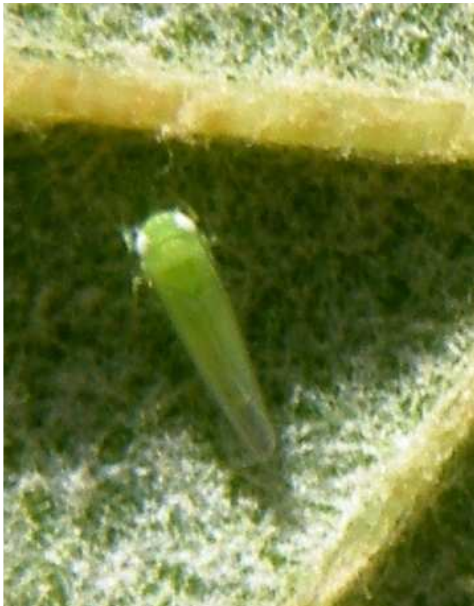
Τζιτζικάκι. Ενήλικο (πτερωτό) έντομο. Είναι τα μεταναστευτικά άτομα του είδους.