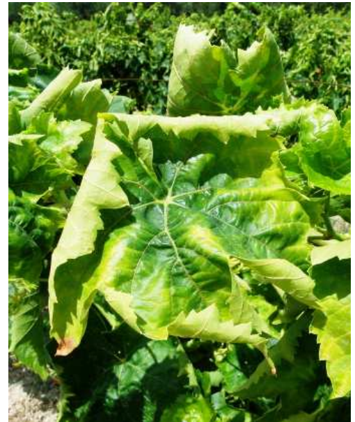
Τζιτζικάκι. Καρούλιασμα και μεταχρωματισμός σε φύλλα ποικιλίας σουλτανί. Στις ερυθρές ποικιλίες ο μεταχρωματισμός είναι κοκκινωπός.