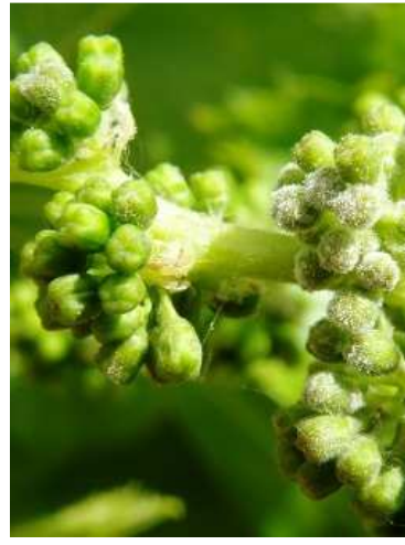
Ωίδιο. Προσβολή σε άνθη (αλευρωμένα)