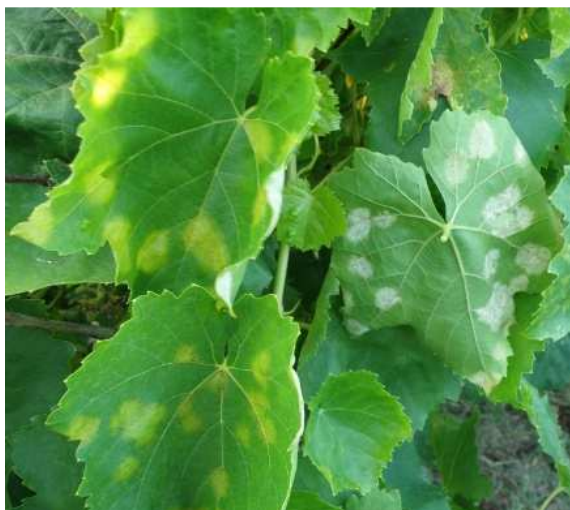
Περονόσπορος. Κηλίδες λαδιού στην πάνω πλευρά και λευκό χνούδι (σπόρια) μόνο στην κάτω πλευρά με υψηλή βραδινή υγρασία