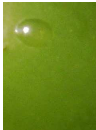
Ευδεμίδα. Αυγά σε νεαρές ράγες (αριστερά) ευδιάκριτα με γυμνό μάτι (μέγεθος μικρής φακής) και αυγό σε μεγεθυντικό φακό (δεξιά).