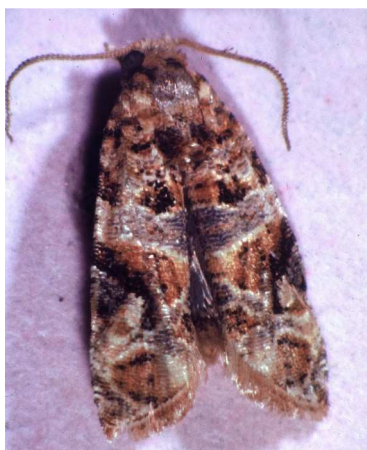
Ευδεμίδα. Τέλειο έντομο. Πεταλούδα περίπου 1εκ.