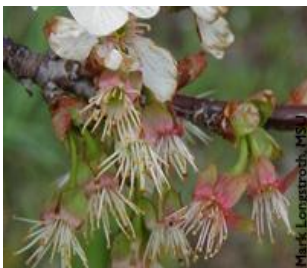
Κερασιά / Βυσσινιά