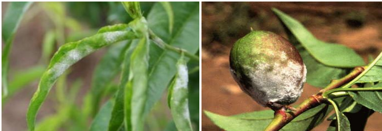
Σύμπτωμα ωιδίου σε νεκταρινιά

Οι ψεκάσμοι αυτοί θα μπορούσαν να συνδυαστούν με εκείνο για τη Φαιά Σήψη (Μονίλια).