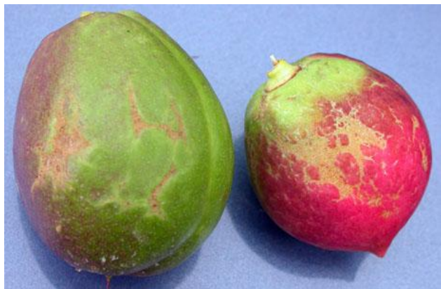
Προσβολή θρίπα σε νεκταρίνια.