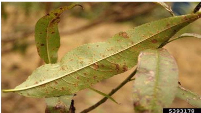
Σύμπτωμα σκωρίασης σε φύλλα ροδακινιάς.

Ο ψεκάσμος αυτός θα μπορούσε να συνδυαστεί με εκείνο για τη Φαιά Σήψη (Μονίλια)