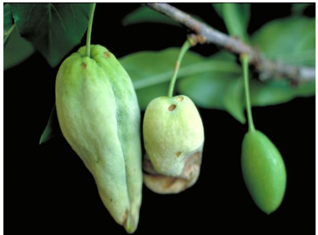
Σύμπτωμα εξώασκου σε φύλλωμα ροδακινιάς και σε καρπούς δαμασκηνιάς