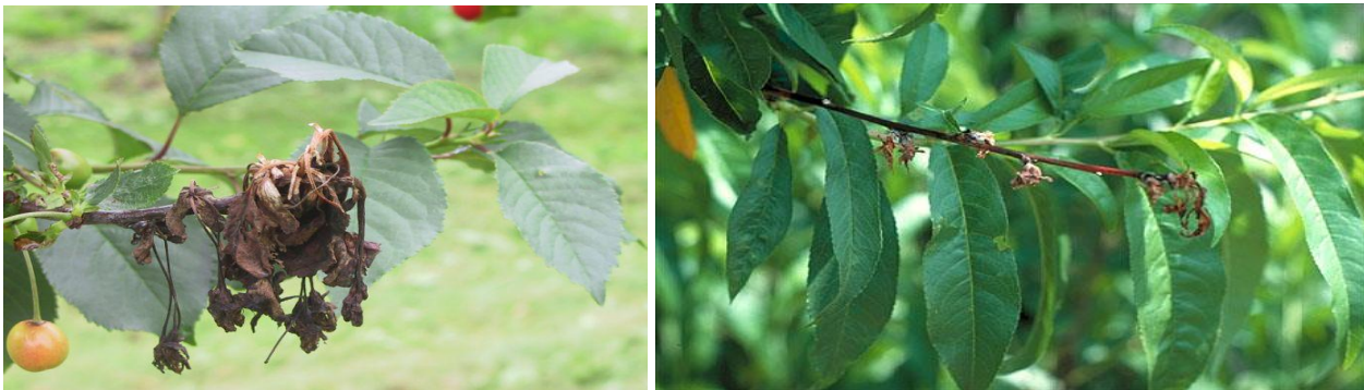
Προσβολή κερασιάς και ροδακινιάς από Μονίλια.

Για την αποφυγή ανάπτυξης ανθεκτικότητας του μύκητα, συνιστάται η συνεχής εναλλαγή μυκητοκτόνων από διαφορετικές χημικές ομάδες.