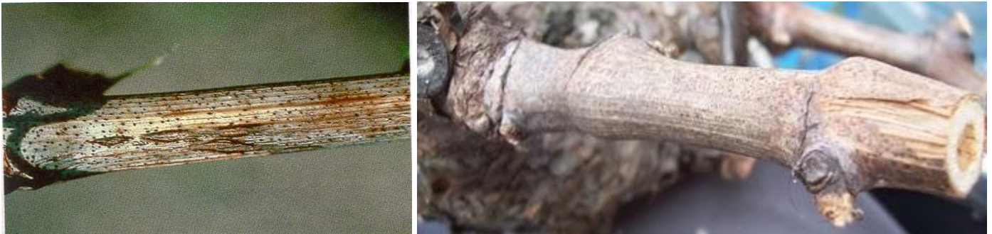
Εικ. Χαρακτηριστική προσβολή κληματίδων από φόμοψη—μακρόφομα.

1. ΦΟΜΟΨΗ—ΜΑΚΡΟΦΟΜΑ. Πρόκειται για συγγενείς μύκητες, που διαχειμάζουν υπό μορφή πυκνιδίων στην επιφάνεια των προσβεβλημένων κληματίδων. Αυτές πρέπει να απομακρύνονται άμεσα και να καίγονται. Ο χαλκός συμβάλει την καταστροφή των πυκνιδίων.