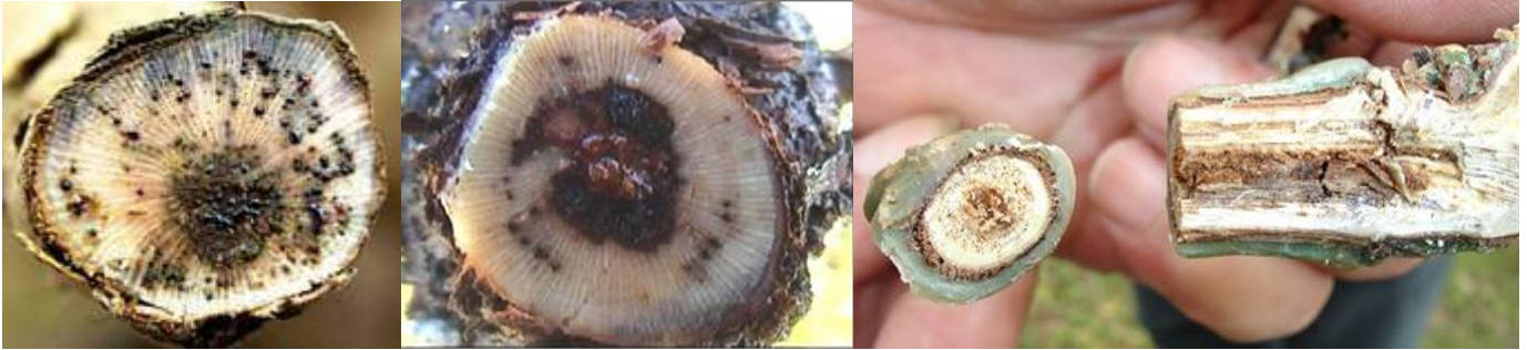
Εικ. (1—6). Τομές βραχιόνων και κληματίδων με χαρακτηριστικά συμπτώματα προσβολής από μύκητες του ξύλου (μεταχρωματισμοί και αλλοιώσεις). Η διαπίστωση τέτοιων συμπτωμάτων κατά τη διαδικασία του κλαδέματος, πρέπει να κινητοποιήσει άμεσα τους αμπελουργούς.