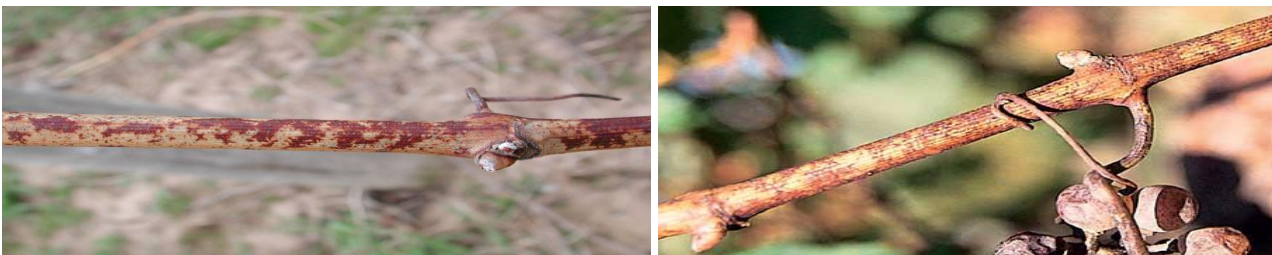
Εικ. Χαρακτηριστική προσβολή κληματίδων από ωΐδιο.

2. ΩΪΔΙΟ. Ο μύκητας διαχειμάζει με τη μορφή μυκηλίου στους οφθαλμούς των προσβεβλημένων κληματίδων, καθώς και με τη μορφή κλειστοθηκίων στην επιφάνεια των προσβεβλημένων κληματίδων και των φύλλων. Ο χαλκός συμβάλει την καταστροφή των κλειστοθηκίων.