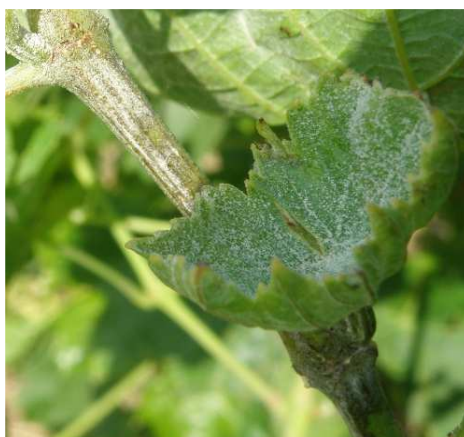
Ωίδιο. Αλευρώδες επίχρισμα (σπόρια) σε φύλλα - βλαστό και κατσάρωμα του φύλλου.