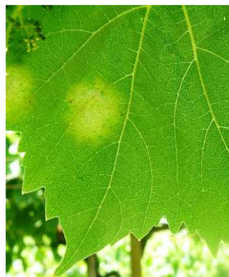
Περνόςπορος. Κηλίδες λαδιού στην πάνω επιφάνεια του φύλλου.