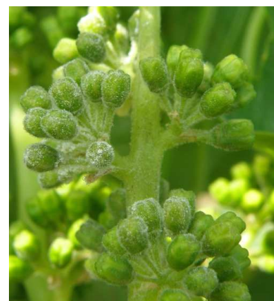
Ωίδιο. Προσβολή σε σταφύλια πριν από την άνθηση με εμφάνιση σπορίων.