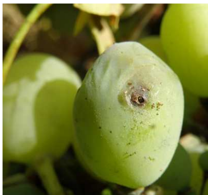
Ευδεμίδα. Προσβολή σε ράγα.