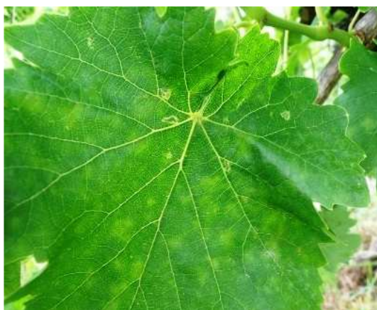
Ωίδιο. Κηλίδες όπως φαίνονται στην πάνω επιφάνεια. Είναι πιο ανοιχτού χρώματος και λιγότερο έντονες από τον περονόσπορο.