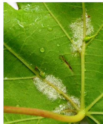
Περνόςπορος. Οι «λαδιές» με υγρασία δίνουν λευκές χιονώδεις εξανθήσεις μόνο στην κάτω επιφάνεια του φύλλου.