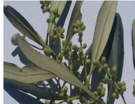
Κρόκκιασμα (στάδιο E)