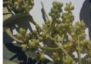
Έναρξη άνθησης (στάδιο F)