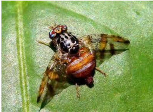
Εικόνα 30 Μύγα Μεσογείου ( Ceratitidis capitata )

μόλυνσης. Επίσης, μπορούν να γίνουν χημικοί ψεκασμοί με οργανοφωσφορικά ή πυρεθροειδή σκευάσματα. Αν θέλουμε να αποφύγουμε τα εντομοκτόνα, χρησιμοποιούμε φερομονικές ή χρωματικές παγίδες. Τέλος, βιολογικά καταπολεμείται με σκευάσματα του μύκητα Beauveria bassiana .