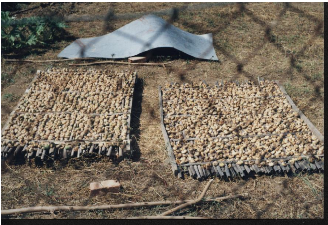
Εικόνα 32 Ξήρανση σύκων σε καλαμοτές