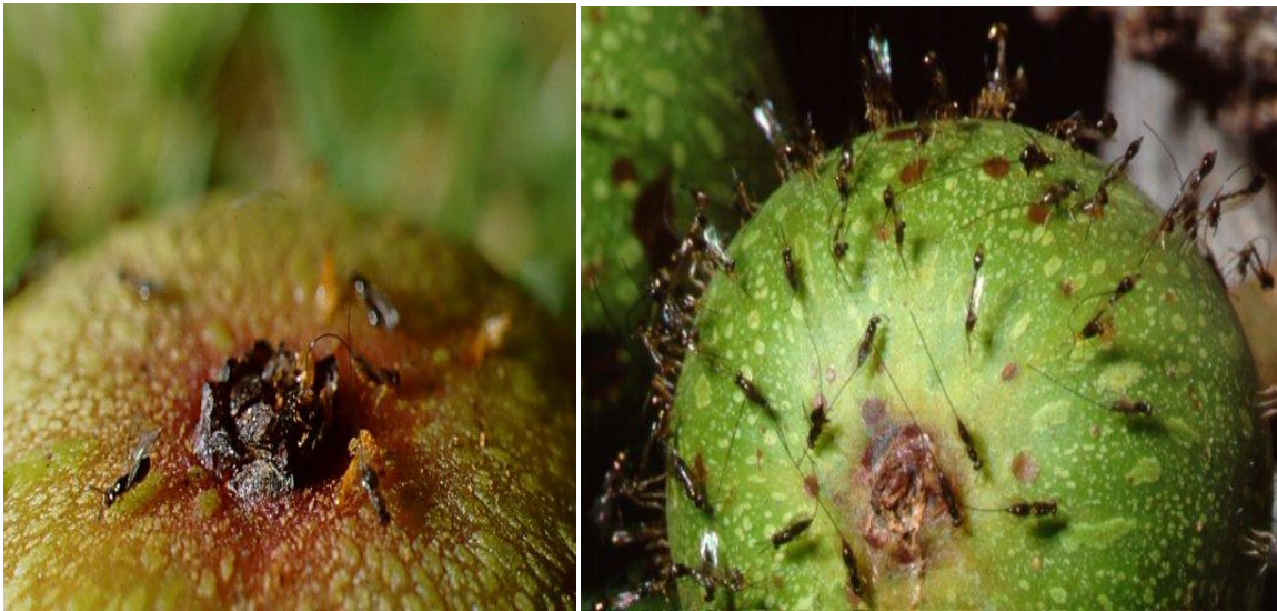
Εικόνα 5 Ο ψήνας [Blastophaga psenes] κατά την είσοδό του στο σύκο