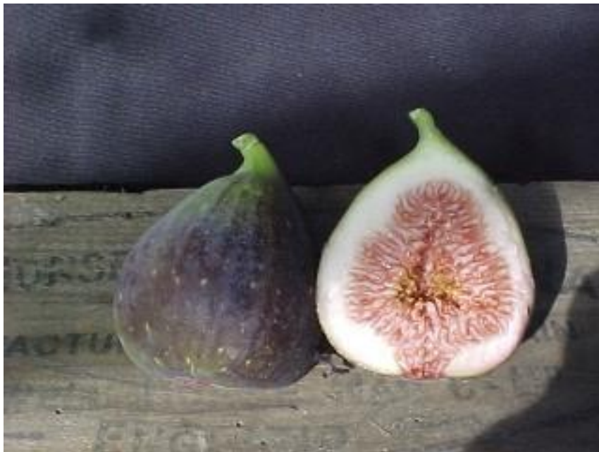
Εικόνα 11 Σύκο ποικιλίας Μπουκνιά Σάμου

Η ποικιλία αυτή είναι γνωστή και με το όνομα San Piero. Καλλιεργείται στην Σάμο, όπως καταλαβαίνουμε και από το όνομα της (Εικ. 11). Ο καρπός έχει μεσσαίο μέγεθος και το σχήμα του είναι αχλαδόμορφο προς επίμηκες. Το χρώμα του φλοιού είναι κάπως μελανό και η σάρκα είναι κοκκινωπή, αλλά όχι πολύ γλυκιά. Ωριμάζει τον Αύγουστο. Το δέντρο είναι παραγωγικό με καλές αποδόσεις και μέτρια ζωηρότητα. Είναι ποικιλία μέτριας ποιότητας και κατάλληλη για νωπή κατανάλωση.