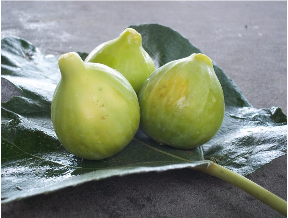
Εικόνα 14 Σύκα ποικιλίας ντοτάτο (dottato)