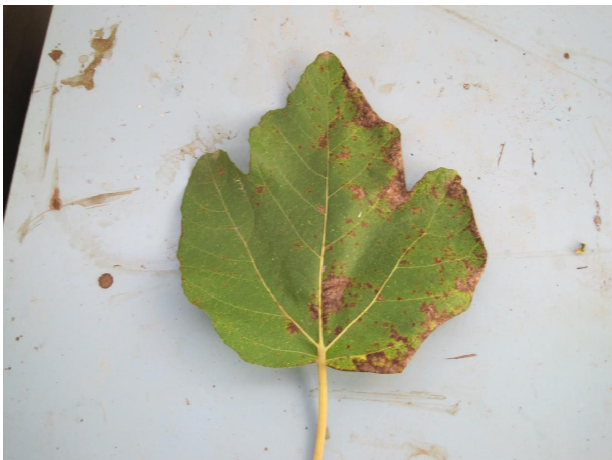
Εικόνα 2 Τρίλοβο φύλλο σικιάς