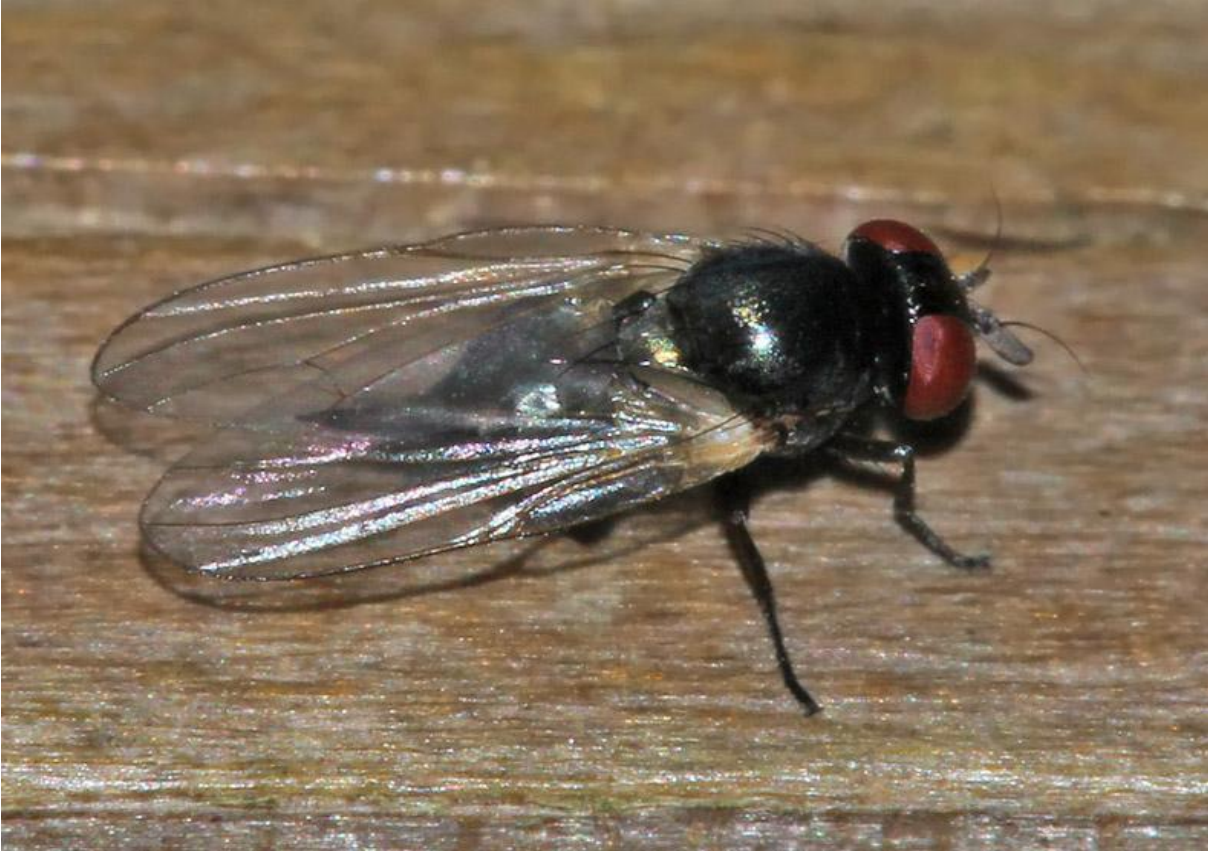
Εικόνα 28 Λογχαία ή μαύρη μύγα της σκιάς ( Silba adipata )