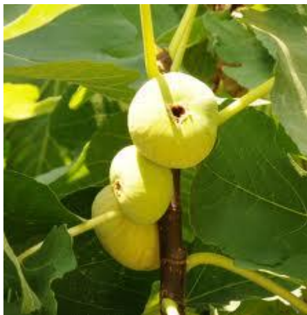
Εικόνα 8 Σύκο ποικιλίας Κύμης

ποικιλία εκλεκτής ποιότητας και μπορεί να χρησιμοποιηθεί και για νωπή κατανάλωση, αλλά και για ξήρανση.