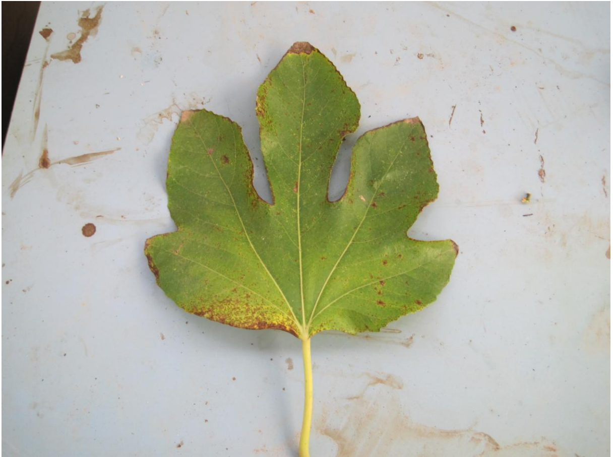
Εικόνα 3 Πεντάλοβο φύλλο συκιάς