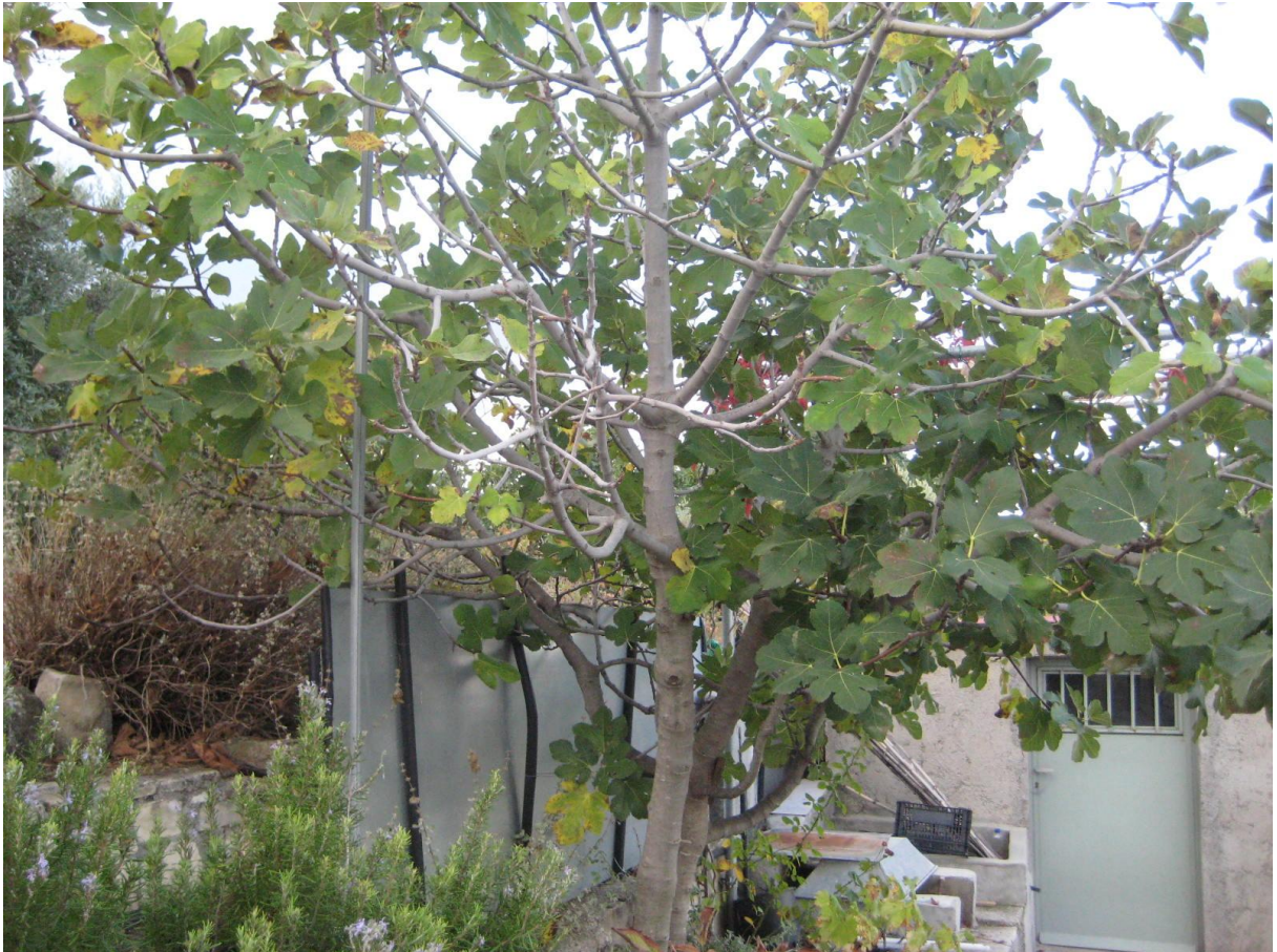
Εικόνα 1 Δέντρο συκιάς στην Κω