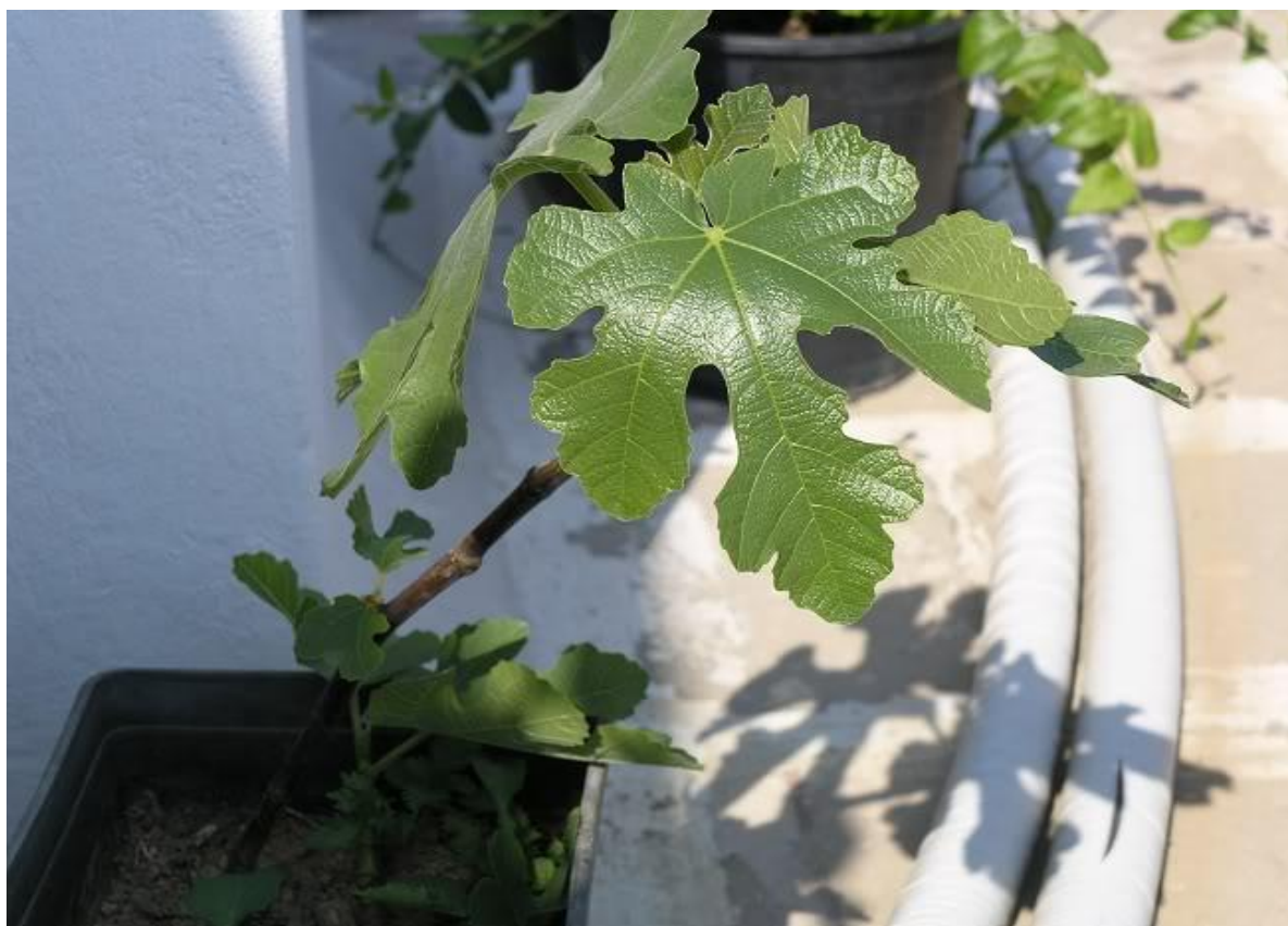
Εικόνα 4 Πεντάλοβο φύλλο συκιάς