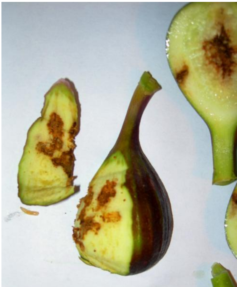
Εικόνα 29 Ζημιά σε σύκα από την λογχαία ή μαύρη μύγα της συκιάς