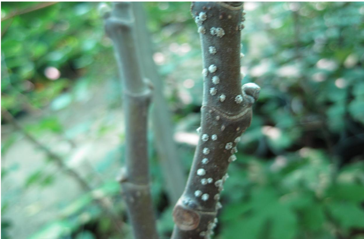
Εικόνα 26. Κηροπλάστης ( Ceroplastis rusci ) σε βλαστό συκιάς (φυτώριο денδροκομίας ΤΕΙ Κρήτης)

Είναι πολυφάγο έντομο. Εκτός από την συκιά προσβάλλει και άλλα δέντρα και θάμνους, όπως πικροδάφνη, μουριά, εσπεριδοειδή και μυρτιά. Έχει 2 γενιές ανά έτος και διαχειμάζει στους κλαδίσκους των φυτών (Εικ. 26 και 27). Τα προβλήματα που προκαλούν οι προνύμφες και τα ενήλικα είναι η μύζηση των χυμών από τους φυτικούς ιστούς και η έκκριση μελιτωδών αποχωρημάτων, που ευνοούν την ανάπτυξη της καπνιάς. Για την καταπολέμηση του συνιστάται ψεκασμός με θερινό πολτό μαζί με ένα οργανοφωσφορικό εντομοκτόνο (Σφιχτέλλης, 2009). Βιολογικός τρόπος καταπολέμησης είναι διάφορα αρπακτικά και παρασιτοειδή που είναι φυσικοί εχθροί του (Ναβροζίδης, Ανδρεάδης, 2012). Αν η προσβολή δεν είναι μεγάλη, υπάρχει και ο απλός τρόπος αφαίρεσης του κηροπλάστη με το χέρι.