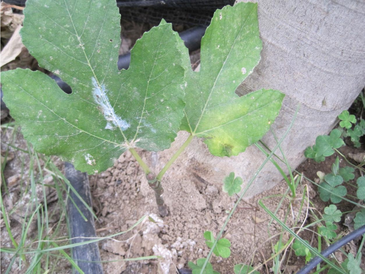
Εικόνα 21 Παραφυάδα στην βάση δέντρου συκιάς (θερμοκήπιο δενδροκομίας ΤΕΙ Κρήτης)