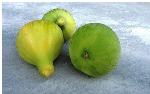
Εικόνα 10 Σύκα βασιλικά άσπρα

Καλλιεργείται και συνιστάται στην Αττική, στα Δωδεκάνησα, στις Κυκλάδες και στην Κρήτη. Είναι και αυτή μονόφορη, όπως και η βασιλική μαύρη. Ο καρπός της έχει μεγάλο μέγεθος και αχλαδόμορφο σχήμα (Εικ. 10). Το χρώμα του φλοιού της είναι πρασινοκίτρινο, ενώ η σάρκα της έχει κοκκινωπό χρώμα και γλυκίζει. Ωριμάζει από τα τέλη Ιουλίου έως τα τέλη Αυγούστου. Το δέντρο αυτής της ποικιλίας έχει μέτρια ζωηρότητα και δίνει καλές αποδόσεις. Θεωρείται και αυτή εκλεκτής ποιότητας και προορίζεται για νωπή κατανάλωση.