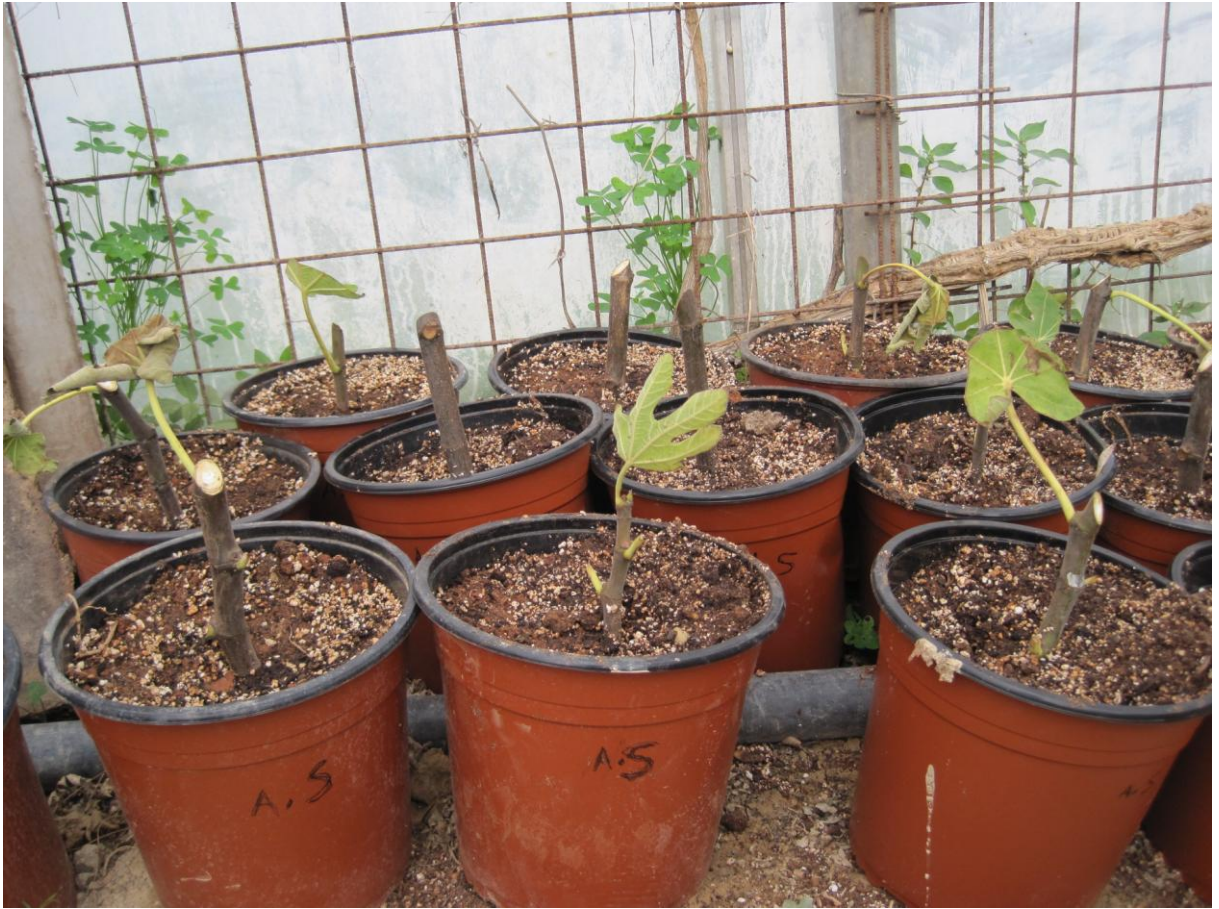
Εικόνα 18 Μοσχεύματα συκιάς σκληρού ξύλου (θερμοκήπιο δενδροκομίας)