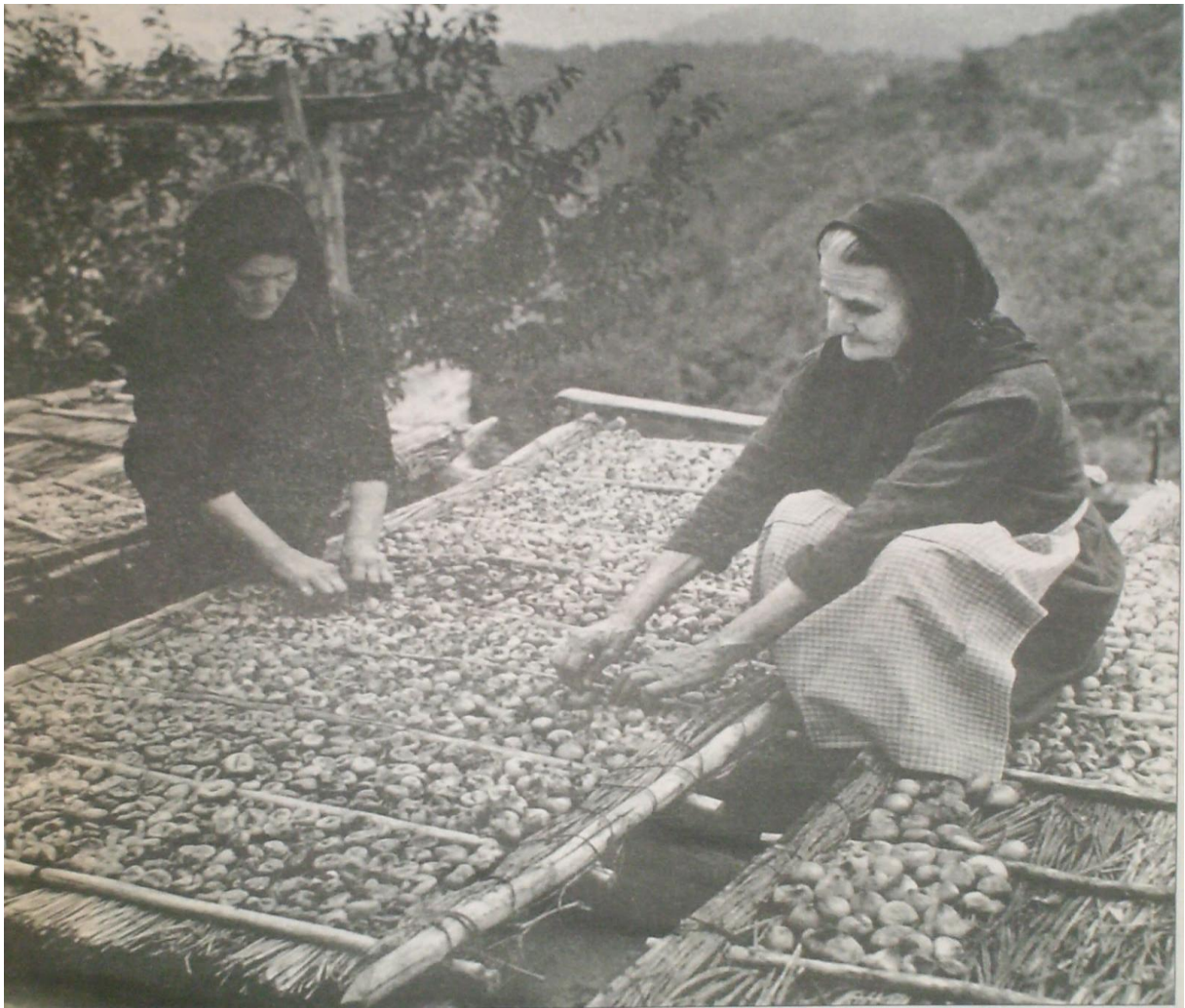
Εικόνα 33 Ξήρανση σύκων στην προπολεμική περίοδο