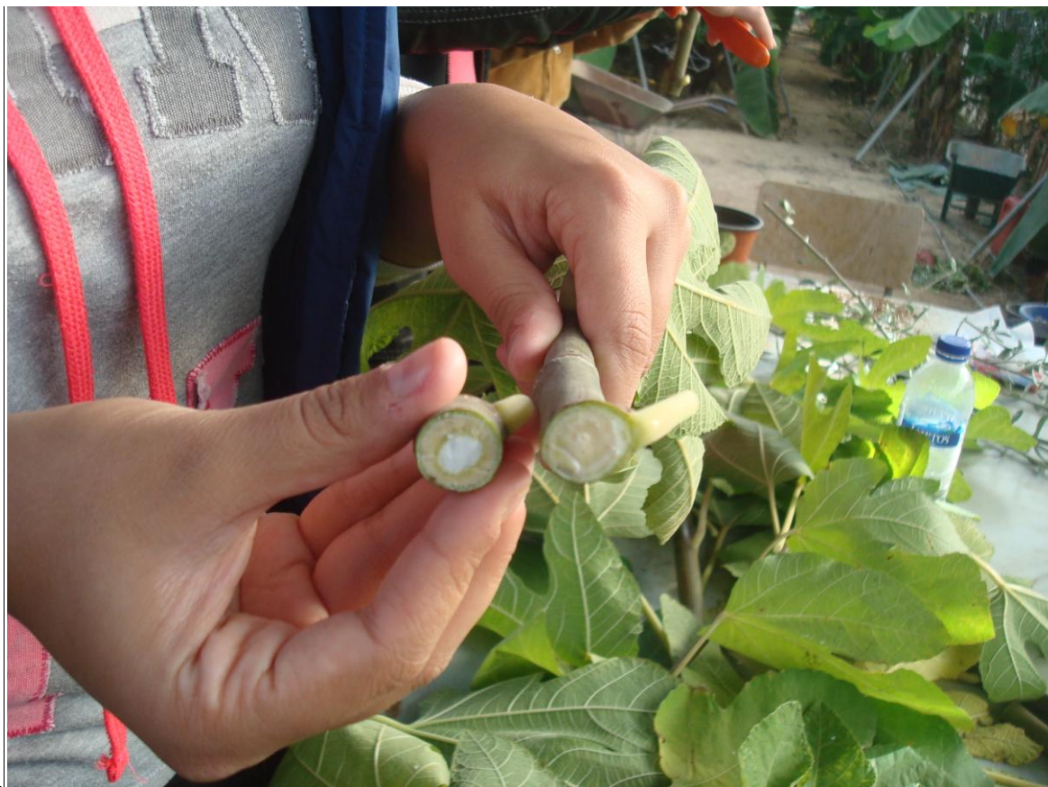
Εικόνα 17 Προετοιμασία μοσχευμάτων συκιάς- κοπή πάνω στο γόνατο (θερμοκήπιο денδροκομίας, ΤΕΙ Κρήτης)