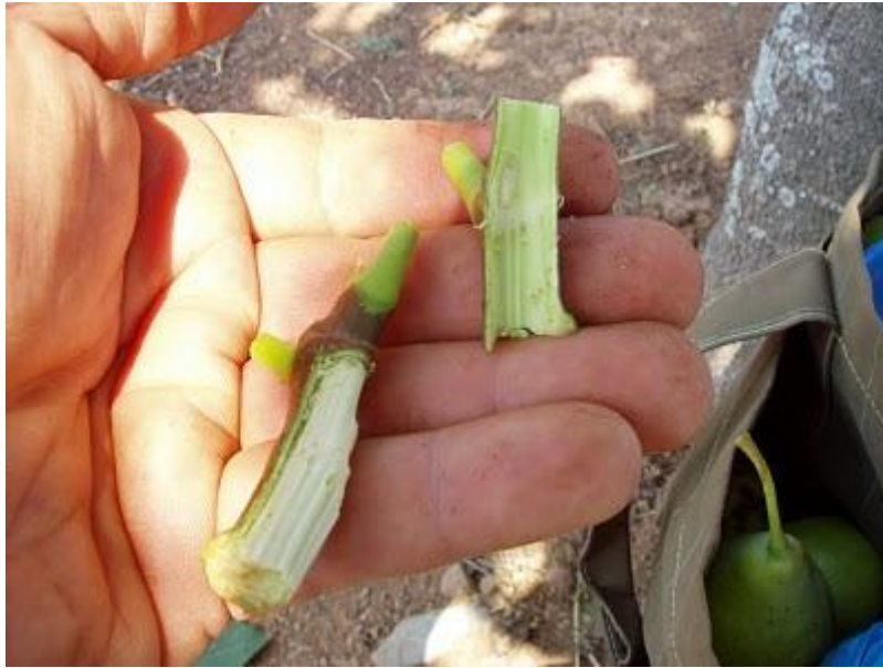
Εικόνα 24 Εξαγωγή εμβολίου (μάτι) από εμβολιοφόρο βλαστό