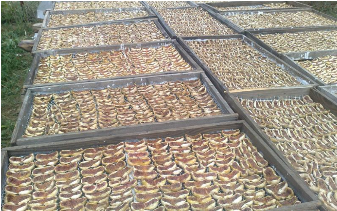
Εικόνα 31 Ξήρανση σύκων σε ταρσούς