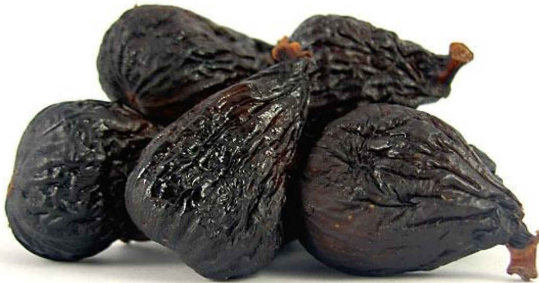
Εικόνα 13 Αποξηραμένα σύκα ποικιλίας Μίσσιον (mission)