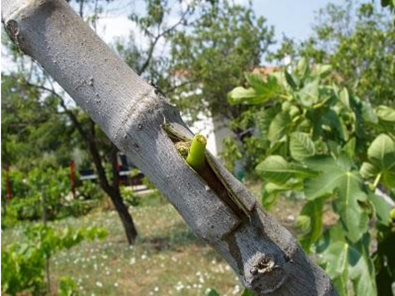
Εικόνα 22 Ενοφθαλμισμός με ανάπτυδο Τ