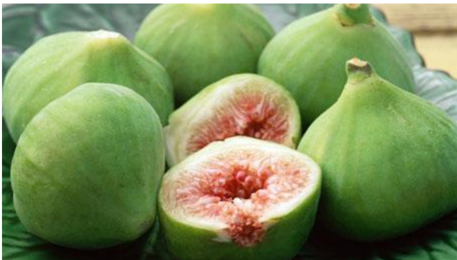
Εικόνα 15 Σύκα ποικιλίας Καλαμών

Ο καρπός αυτής της ποικιλίας έχει μεσσαίο μέγεθος και σχήμα σφαιρικό, ελαφρώς πεπλατυσμένο (Εικ. 15). Το χρώμα του φλοιού είναι πρασινοκίτρινο, ενώ η σάρκα είναι κεχριμπαρί και πολύ γλυκιά. Το δέντρο είναι ζωηρό και παραγωγικό. Είναι ποικιλία εκλεκτής ποιότητας που μπορεί να χρησιμοποιηθεί και για ξήρανση, εκτός από νωπή κατανάλωση. Ωριμάζει αρχές Σεπτεμβρίου.