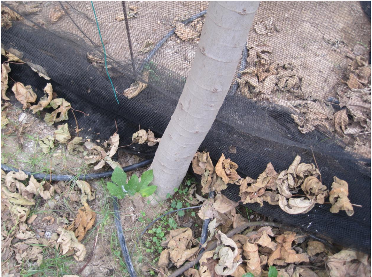
Εικόνα 20 Παραφύαδα στην βάση δέντρου συκιάς (θερμοκήπιο δενδροκομίας ΤΕΙ Κρήτης)