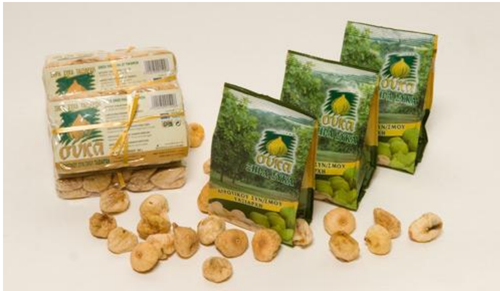
Εικόνα 7 Αποξηραμένα σύκα Ταζιάρχη συσκευασμένα

δεν υπάρχουν πολλά προβλήματα με εχθρούς ή ασθένειες.