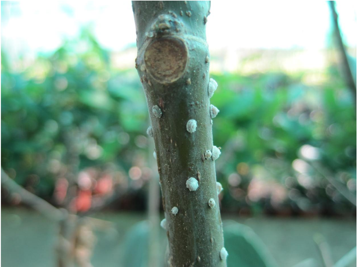
Εικόνα 27 Κηροπλάστης ( Ceroplastis rusci ) σε βλαστό συκιάς (φυτώριο денδροκομίας ΤΕΙ Κρήτης)