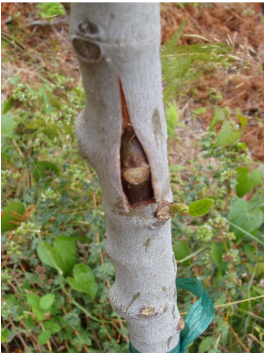
Εικόνα 23 Ενοφθαλμισμός με ανάπτυδο Τ