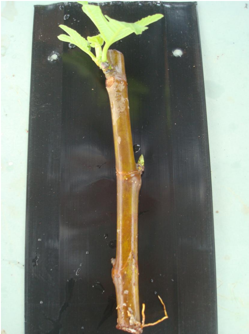
Εικόνα 19 Έρριζο μόσχευμα συκιάς