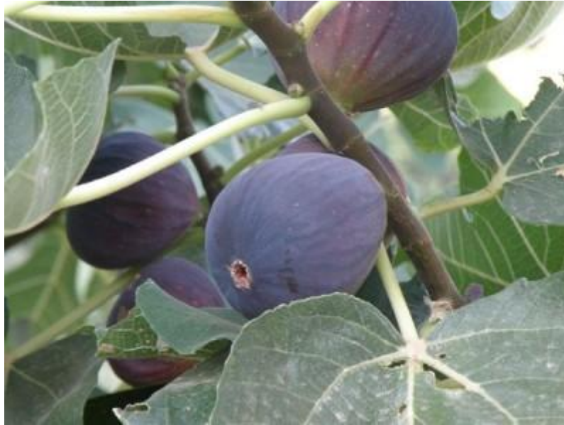
Εικόνα 9 Σύκα βασιλικά μαύρα