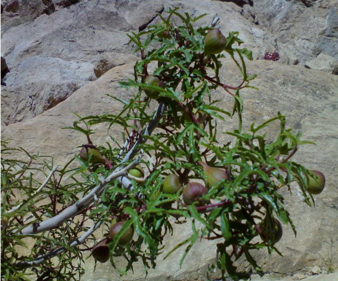
Εικόνα 16 Άγριο σύκο (mountain fig)