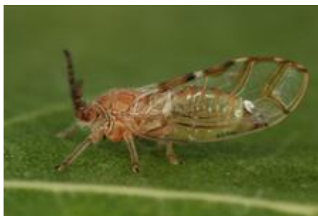
Εικόνα 25 Ψύλλα συκιάς ( Homotoma ficus )

Είναι αποκλειστικά εχθρός της συκιάς, προσβάλλει μόνο αυτήν. Έχει μια γενιά ανά έτος. Αρχικά, διαχειμάζει σαν αυγό στους οφθαλμούς του δέντρου. Την άνοιξη τα αυγά εκκολάπτονται και βγαίνουν οι νεαρές προνύμφες, οι οποίες παραμένουν στους οφθαλμούς για προστασία. Αργότερα, οι προνύμφες πάνε στην κάτω επιφάνεια των φύλλων και μένουν εκεί μέχρι την ενηλικίωση τους. Τα προβλήματα που προκαλούν τα ενήλικα άτομα και οι προνύμφες είναι ότι μυζούν χυμούς από τους ιστούς και εκκρίνουν μελιτώδη αποχωρήματα που ευνοούν την ανάπτυξη μυκήτων καπνιάς. Αποτέλεσμα αυτών, η ανάσχεση ανάπτυξης των φυτών και η ποιοτική υποβάθμιση των καρπών. Το έντομο αυτό (Εικ. 25) δεν καταπολεμάται χημικά, γιατί δεν υπάρχουν εγκεκριμένα εντομοκτόνα. Καταπολεμάται βιολογικά με κάποια αρπακτικά που είναι θηρευτές των αυγών και των προνυμφών του (Ναβροζίδης, Ανδρεάδης, 2012).