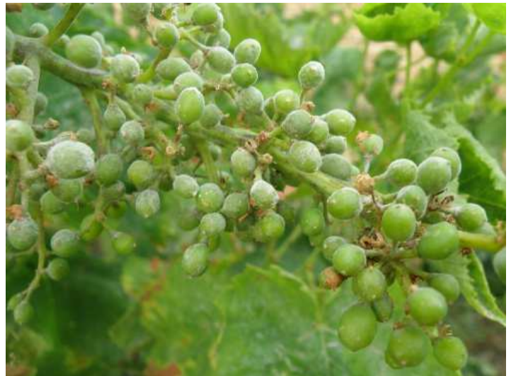
Ωίδιο. Αλευρώδες γκριζόλευκο χνούδι σε νεαρές ράγες και στους άξονες των σταφυλιών.

Πληροφορίες: Νίκος Ι. Μπαγκής – Ευάγγελος Α. Αλατοσιανός