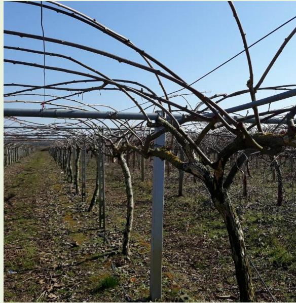
Εικόνα 1 & 2. Πρέμνα ακτινιδιάς πριν & μετά το κλάδεμα

Η εφαρμογή γεωργικών φαρμάκων πρέπει να γίνεται από κατόχους πιστοποιητικού γνώσεων Ο.Χ.Γ.Φ.