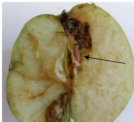
Καρπόκαψα. Εσωτερικά η προσβολή. Διακρίνεται η προνύμφη του εντόμου.