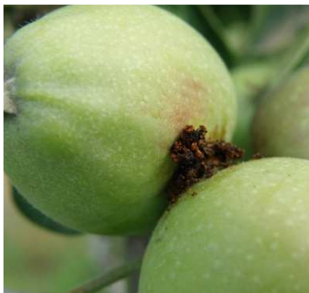
Καρπόκαψα. Προσβολή στο σημείο επαφής των καρπών.