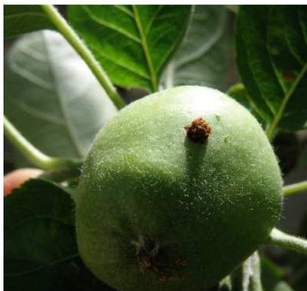
Καρπόκαψα. Προσβολή νεαρού καρπού.