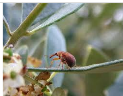
Εικόνα 1: Ακμαίο Ρυγχίτη