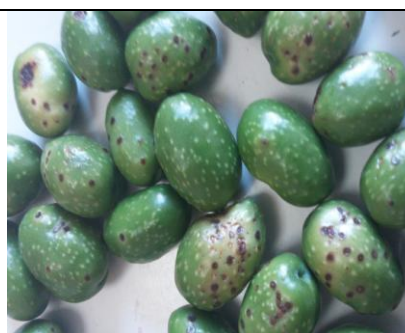
Εικόνα 2: Προσβολές σε καρπούς από ρυγχίτη