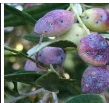
Εικόνα 3: Προσβολή σε καρπούς από ρυγχίτη

Έχουν παρατηρηθεί προσβολές από ρυγχίτη τοπικά σε όλες τις περιοχές της καλλιέργειας. Τα ακμαία άτομα του ρυγχίτη τόσο κατά την διατροφή τους όσο και κατά την ωοτοκία τους σχηματίζουν στην επιφάνεια των καρπών τρύπες με το ρύγχος τους, οι οποίες έχουν μορφή κρατήρα και οι προσβεβλημένοι καρποί πέφτουν.