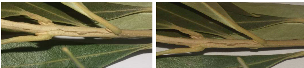
Εικόνες 2,3 Σχισίματα από τον παγετό σε βλαστούς της ελιάς στο Ν.Μαγνησίας (εικόνες Π.Κ.Π.Φ&Π.Ε Βόλου)

ΔΙΑΠΙΣΤΩΣΕΙΣ: Οι χαμηλές θερμοκρασίες με παγετούς έχουν ως αποτέλεσμα την δημιουργία πληγών ,σχισίματα και αποκόλληση του φλοιού σε βλαστούς και κλάδους των ελαιόδένδρων. Οι πληγές αυτές και τα ανοίγματα αποτελούν σημεία εισόδου του βακτηρίου στα ελαιόδεντρα.