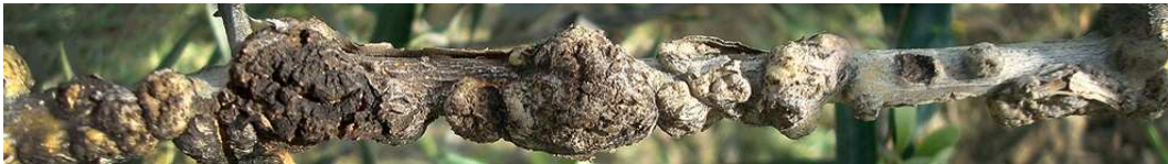
Εικόνα 1 Προσβολή από το παθογόνο βακτήριο Pseudomonas syringae subsp. Savastanoi