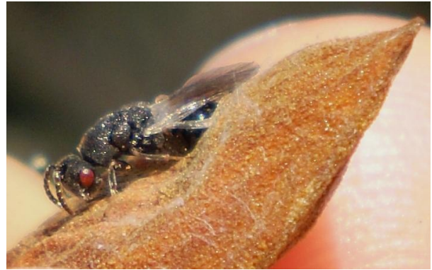
Εικόνα 5 Προνύμφη Ευρύτομου και τέλειο εξερχόμενο από τον καρπό όπου νυμφώθηκε.