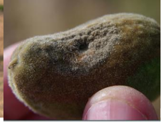
Εικόνα 1 Συμπτώματα μονιλίας σε βλαστό και καρπό αμυγδαλιάς