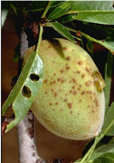
Εικόνα 3 Συμπτώματα κορύννεου σε φύλλα (τρύπες από σκάγια), βλαστό και καρπό