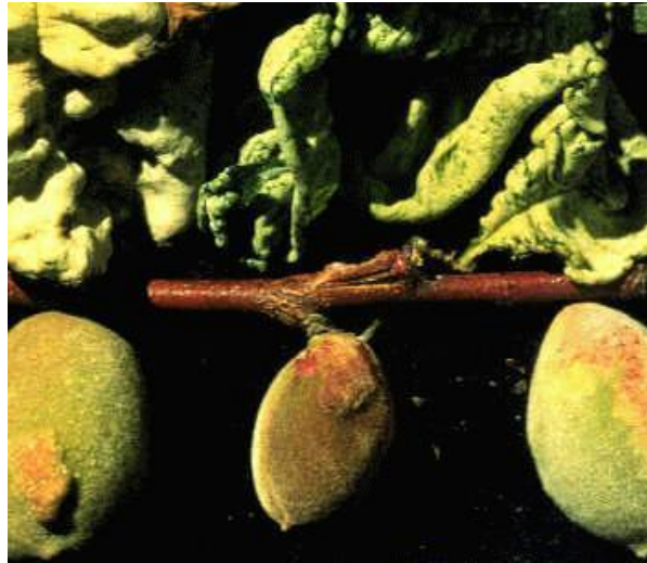
Εικόνα 2 Συμπτώματα εξώασκου σε φύλλα και καρπούς αμυγδαλιάς