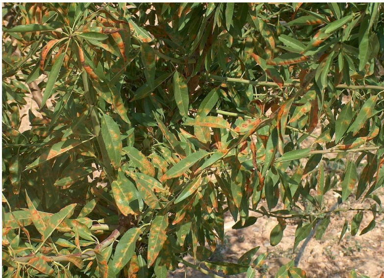
Εικόνα 4 Πολυστίγμωση