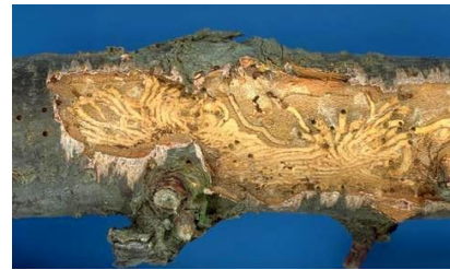
Εικόνα 6 Προσβεβλημένο δένδρο αμυγδαλιάς από σκολύτη.