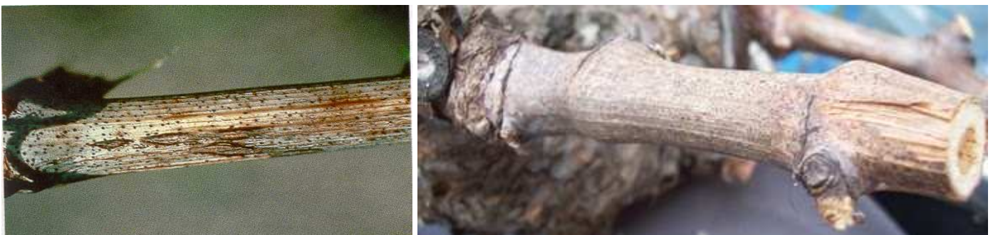
Εικ. Χαρακτηριστική προσβολή κληματίδων από φόμοψη—μακρόφομα.

1. ΦΟΜΟΨΗ—ΜΑΚΡΟΦΟΜΑ. Πρόκειται για μυκητολογικές ασθένειες που προκαλούνται από συγγενείς μύκητες, οι οποίοι διαχειμάζουν υπό μορφή πυκνιδίων στην επιφάνεια των προσβεβλημένων κληματίδων. Για το λόγο αυτό, οι προσβεβλημένες κληματίδες πρέπει να απομακρύνονται άμεσα και να καίγονται. Ο χαλκός συμβάλει την καταστροφή των πυκνιδίων.