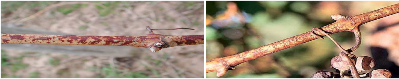
Εικ. Χαρακτηριστική προσβολή κληματίδων από ωίδιο.