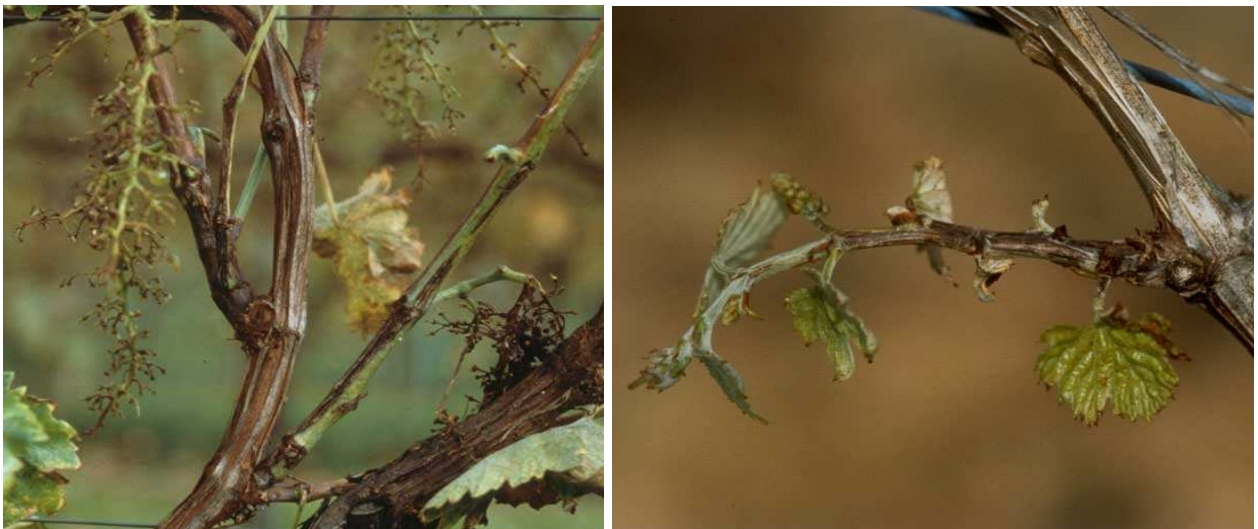
Εικ. Χαρακτηριστικά επιμήκη έλκη της ασθένειας σε κληματίδες./Προσβεβλημένος τρυφερός βλαστός.

Προκαλεί ξηράνσεις κεφαλών και βραχιόνων, με αποτέλεσμα τη σταδιακή εξασθένηση των πρέμνων και την έξοδό τους από την παραγωγή. Τα συμπτώματα της ασθένειας είναι ορατά με την έναρξη της βλάστησης. Ορισμένες κεφαλές του προσβεβλημένου πρέμνου δεν βλαστάνουν ή δίνουν ασθενικούς βλαστούς που αποξηραίνονται αργότερα. Συνήθως η προσβολή εντοπίζεται προς τη μία πλευρά του πρέμνου. Ευπαθείς στις μολύνσεις είναι οι τρυφερές κληματίδες μέχρι μήκους 10 εκ. Η μετάδοση της ασθένειας ευνοείται από βροχερό καιρό και σε μεγάλο θερμοκρασιακό εύρος (0°C–30°C). Μεγαλύτερη ευπάθεια στη βακτηρίωση παρουσιάζουν οι ποικιλίες Σουλτανίνα και Ραζακί.